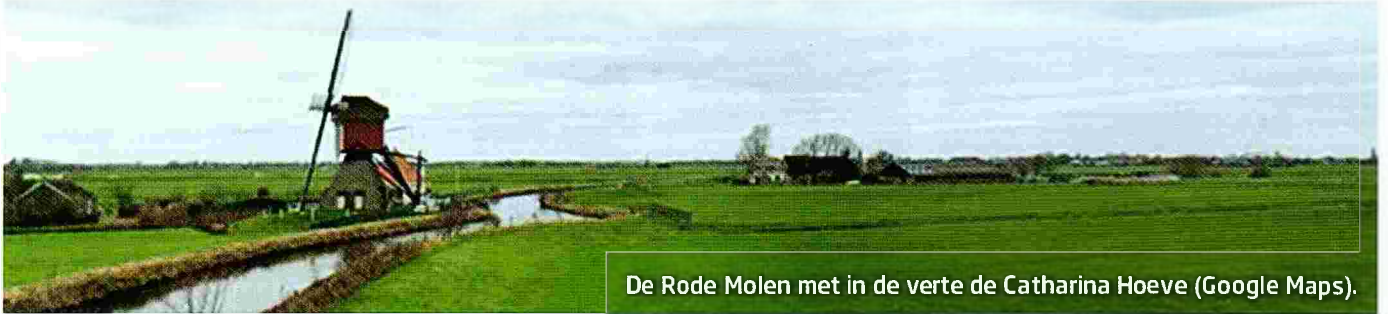
De Rode Molen met in de verte de Catharina Hoeve (Google Maps).