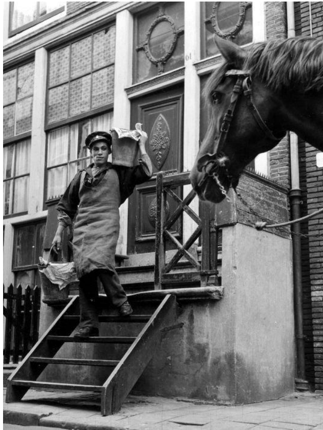
Een stronttonnetjesschepper heeft twee emmers met uitwerpselen opgehaald uit een huis in de Jordaan in Amsterdam, en begeeft zich naar zijn boldoetkar. 13 september 1953. (geënsceeneerd?).