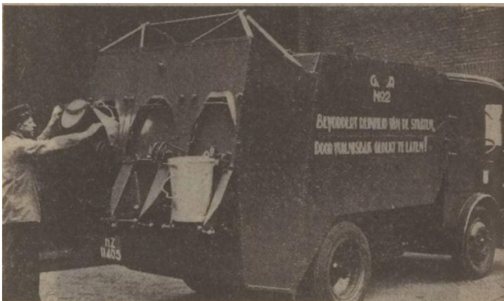
Een korrelige krantenfoto van de roltrommel-vuilniswagen en de uniforme vuilnisemmers. Leidsch Dagblad 8 februari 1940.