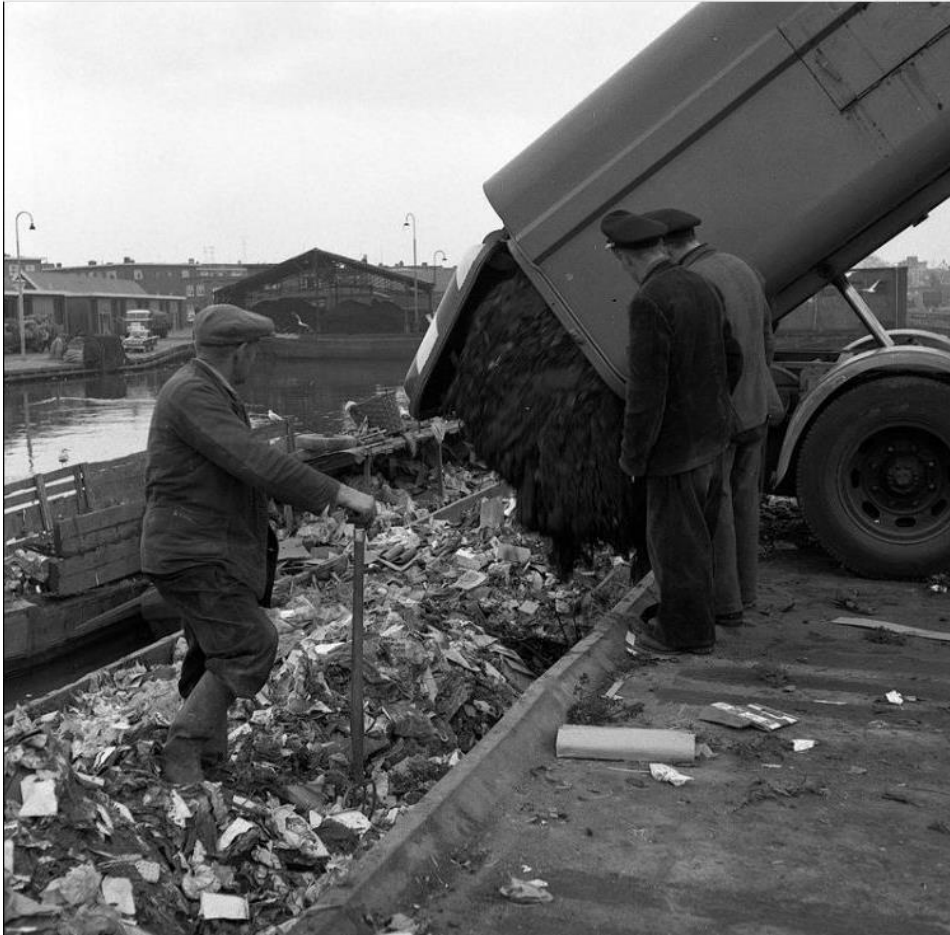
Het afval wordt in schuiten gelost en naar een stortplaats buiten de stad gebracht. Deze foto is in 1959 in Utrecht gemaakt.