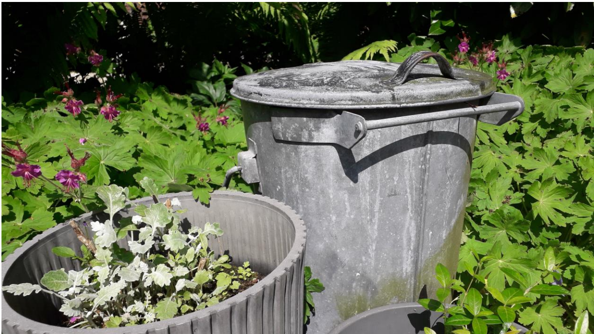
Klassieke vuilnisemmer verfraait de bloementuin (Oud-Ade 2023)