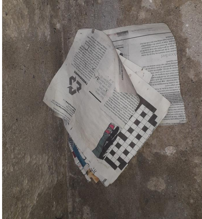
Antiek toiletpapier aan een touwtje in een gepreserveerde buitenplee in Oud-Ade (2023)