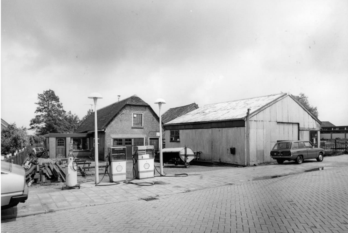
Vooraanzicht van smedery Straathof, Koppoellaan 12 te Rijpwetering rond 1985. Van links naar rechts: winkel, smedery, benzinepompen en loods. (JoopStraathof)