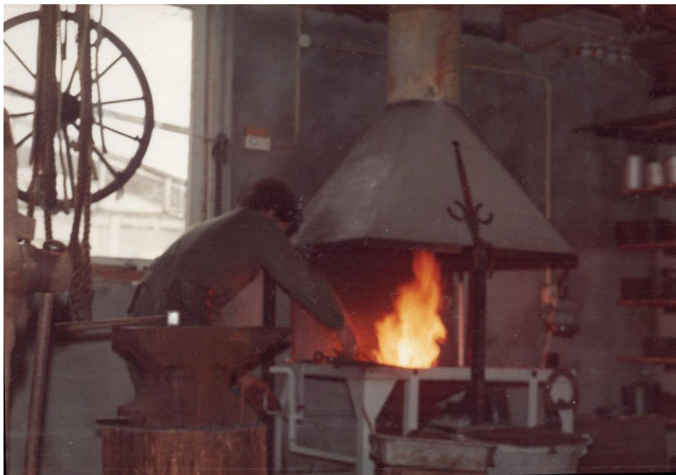
Wim van der Ploeg, 1986, in zijn smedery. "Het vuur wordt opgestookt en het ijzer heet en rood"