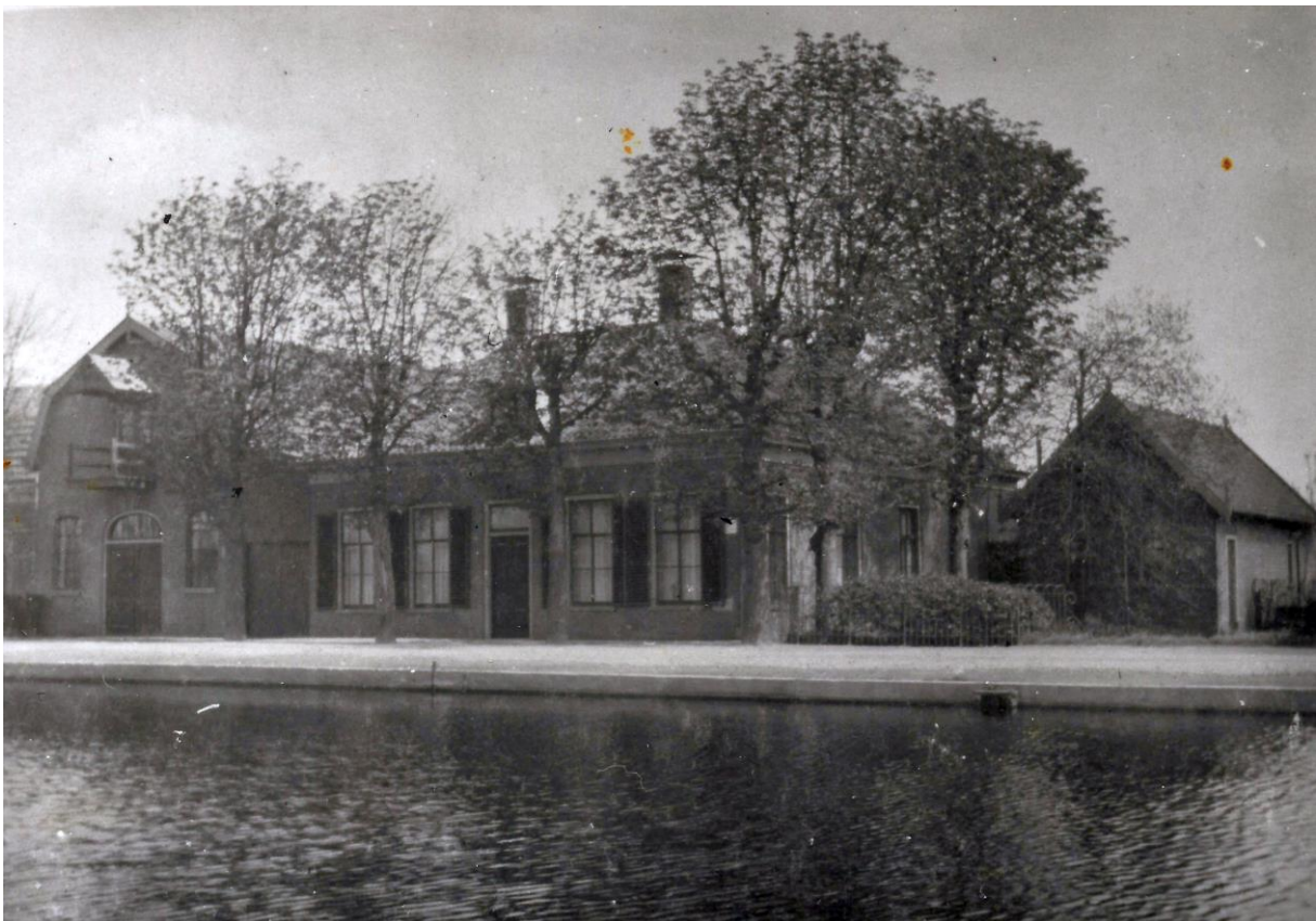
Links de maalterij van Beelen in het dorp aan de Rijpwetering. In het huis ernaast woonde Gerrit met zijn gezin. Uiterst rechts de schuur/garage die later werd afgebroken. Foto rond 1917.