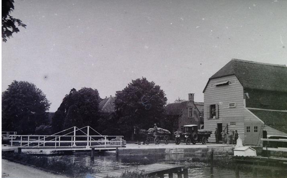
De opslagruimte van Warmerdam en Beelen, vermoedelijk in de jaren 20, naast de Oude Pastorie (midden). De paardenwag en de vrachtwagen zijn duidelijk zichtbaar.