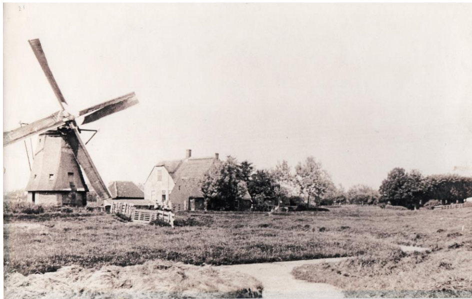
De korenmolen aan de Kleipoel, in het midden (het hoge gebouw) de grutterij, rechts achter de bomen de woning van Gerrit Beelen. Foto ca 1900.