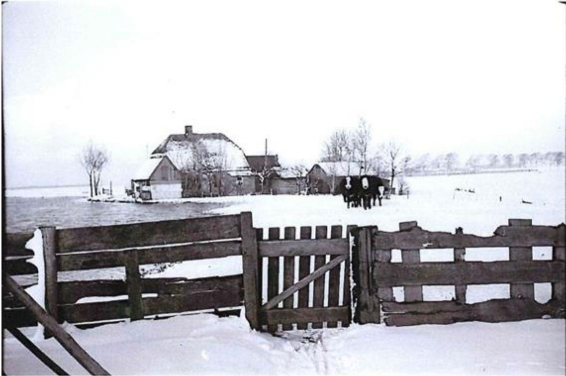
De Kippendijk, winterlandschap met koeien.