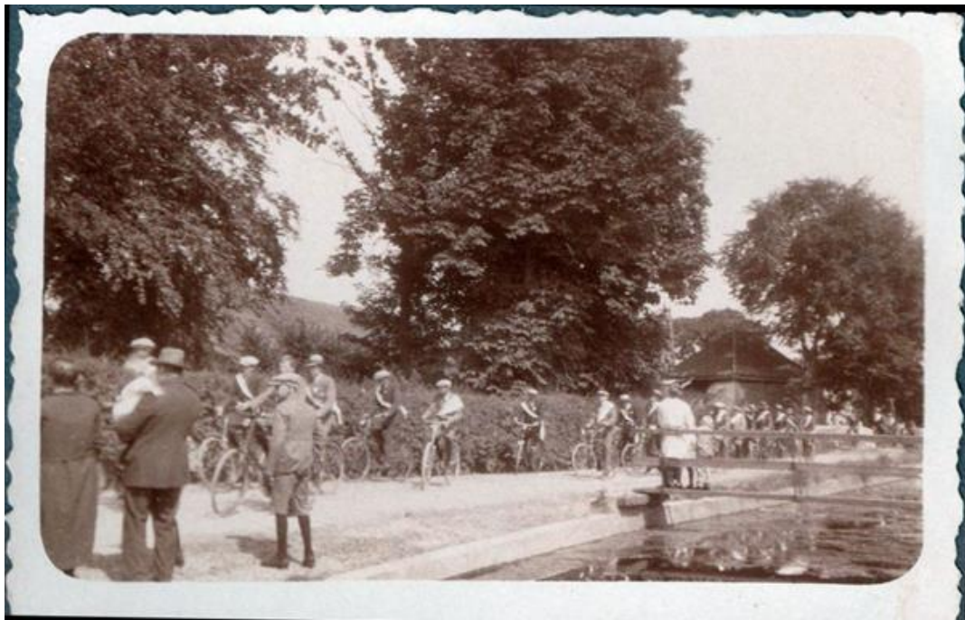
Een stoet met sjerpen getooide fietsers rond 1935, waarschijnlijk tijdens de kermis. Rechts is de voetbrug over de Kolk te zien.

In de nagelaten foto's van Gerard Vrijburg, bij zijn dochter Petra, tref ik een album aan van foto's die door haar vader zelf zijn gemaakt en hoogst waarschijnlijk ook ontwikkeld en afgedrukt. Bij het album vind ik nog tien nummers van FOCUS , een "veertiendaagsch fotoblad" met instructies en informatie over fotograferen, jaargang 1934. Zijn foto's zijn kleine exemplaren want over een vergrotingsapparaat beschikte vader Gerard niet.