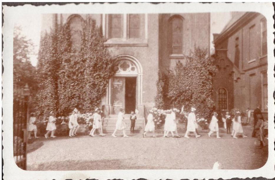
Bruides voor de kerk van Oud-Ade (ca. 1935).