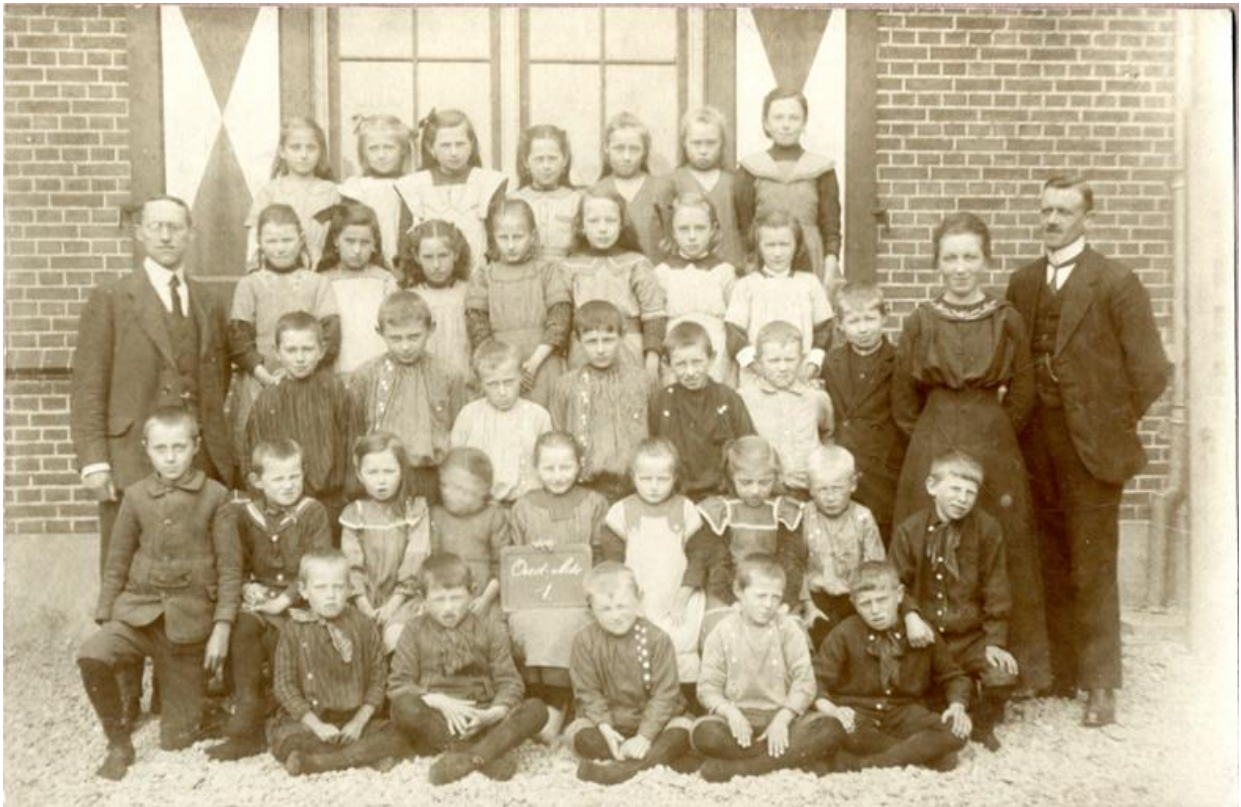
Schoolfoto Oud-Ade, ca 1918. fotograaf Jacobs & Zn, Vrolijkstraat 105, Amsterdam (afkomstig uit familiealbum Corrie Uljee).