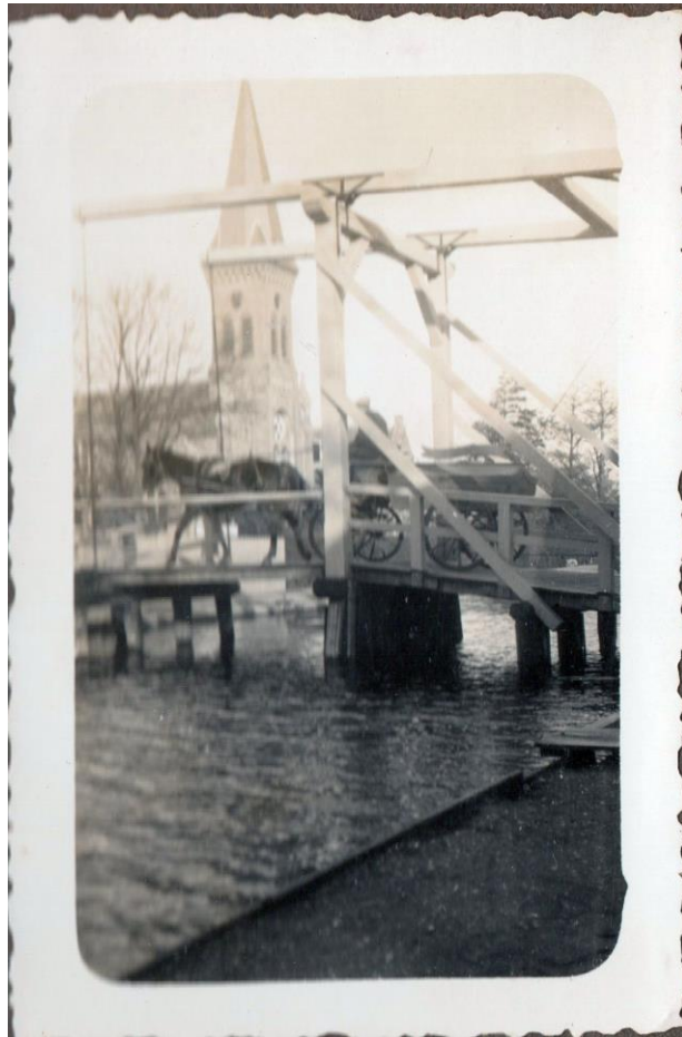
Een tilbury rijdt over de brug van Oud-Ade (ca. 1935).