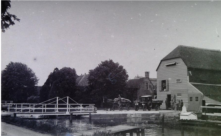
De opslagruimte van Warmerdam en Beelen, vermoedelijk in de jaren 1920, naast de oude pastorie (midden). De paardenwagen en de vrachtwagen zijn duidelijk zichtbaar.