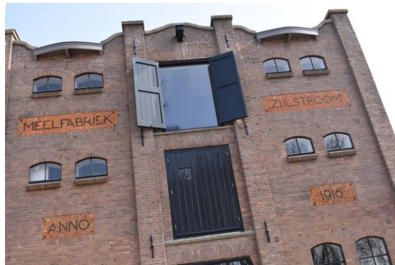
De Zijlstream, nu een brasserie

In 1916 bouwde veehouder Jac. de Graaf aan de Zijldijk in Leiderdorp, zo'n 200 meter vóór de Zijlbrug (vanuit de Kaag gezien) een meelfabriek, de Zijlstream, om daarmee voer te produceren voor zijn eigen gigantische veestapel. Achter de maalderij lag zijn land en bouwde hij schuren en stallen voor zijn vee. Hij legde een treinspoortje aan vanaf de Zijl (waar de schepen met graan aanlegden) naar de maalderij en verder naar de twee stallen met koeien. De Zijlstream was een bouwwerk met allure in late Art Nouveau-stijl, naar een ontwerp van architect A.T. Kraan uit Oegstgeest. De Graaf ging echter in 1923 failliet en vertrok naar Amerika, waarna Gerrit van der Geest de maalderij overnam. Het boerderij gedeelte werd verkocht aan Teun van der Meij.