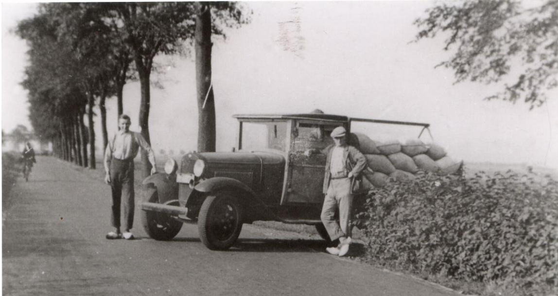
Piet (rechts) en Gerrit jr, waarschijnlijk bij de uitrit van het pakhuis aan de Langebrug naar de Leidseweg, toen er nog bomen langs stonden.

Twee zonen, Piet (1914-2004) en Gerrit jr (1919-2010), werden al op jonge leeftijd, na de lagere school, als 'krullenjongen', ingeschakeld in het bedrijf. In 1953 werden zij mede-firmant en zetten het bedrijf voort. Wanneer Gerrit senior precies stopte heb ik niet kunnen achterhalen; waarschijnlijk ging dat geleidelijk. Piet vestigde zich na zijn trouwen (1946) op Leidseweg 30 in het dorp. Gerrit trok met zijn vrouw in bij zijn ouders aan de Langebrug maar bouwde in 1960/1961 een eigen woning enkele meters verderop, aan de andere kant van het pakhuis. De schuur die er stond (zie foto) werd afgebroken. Piet was meest werkzaam in de maalderij terwijl Gerrit de boekhouding deed en de boer op ging om te 'vragen' (bestellingen op te nemen).