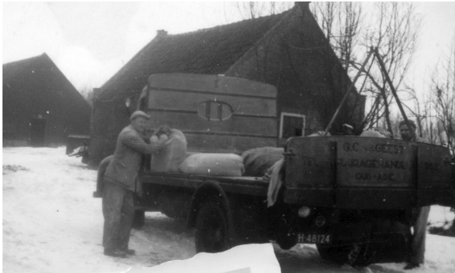
In strenge winters kon de vrachtwagen boerderijen over het ijs bereiken, zoals hier in 1963 bij het Klaverblad. Links boer Kobus van der Geest (Klaverblad), rechts Gerrit van der Geest jr..