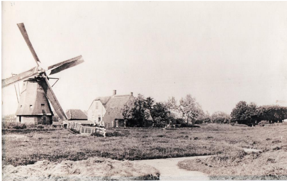
De laatst bekende foto van de korenmolen met rechts daarvan de grutterij.