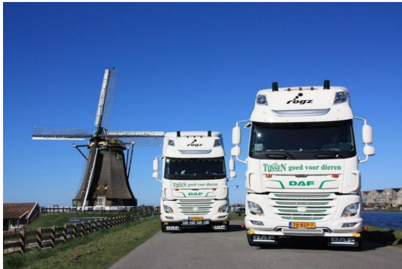
Het bedrijf dat overleefde: Firma Tijssen, "goed voor dieren", (foto van de site van het bedrijf).

De tijden veranderen. Net als de veeboer krijgt de meelboer steeds meer te maken met regels en beperkingen en (mede daarom) kiest de volgende generatie veelal een ander beroep. Net als bij de boeren wordt het steeds moeilijker om 'klein' te overleven. Aan schaalvergroting is niet te ontkomen, de risico's om te investeren zijn groot. Dat geldt zowel voor het bedrijf van Beelen in Rijpwetering als dat van de firma Van der Geest & Zonen in Oud Ade, zoals deze twee geschiedenisverhalen hebben laten zien.