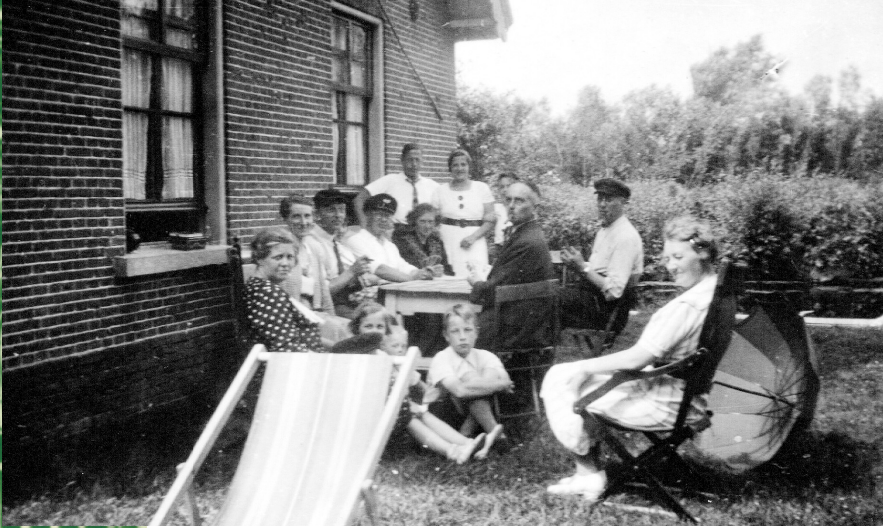
Watersportmensen vóór boerderij Het Klaverblad (ca. 1940). Ze hebben hun eigen vakantiestoelen meegebracht. Gezellig!

De gasten maakten foto's van het leven op de boerderij en het gezin van de boer. Dankzij de 'sport' beschikken we nu over waardevolle boerderijfoto's. Lodewijk van der Wolk die een woonboot bij Het Klaverblad bezat, maakte rond 1970 zelfs een film over voor toeristen interessante plattelandsactiviteiten, zoals hooibouw, schapen scheren en schaatswedstrijden.