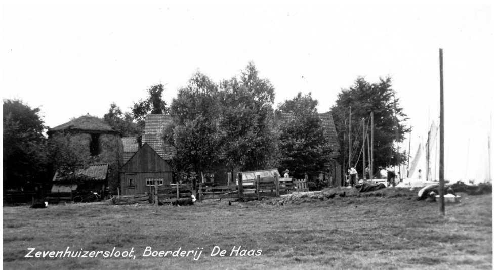
Zevenhuizersloot, Boerderij De Haas

Opa Kees begon in 1931 (volgens de Kamer van Koophandel) met het huisvesten van watersporters bij en op de boerderij. Er lagen zeilboten voor het huis en in stallen en schuren werden verblijfplaatsen voor de vakantiegangers gecreëerd, zoals dat vaak gebeurde bij