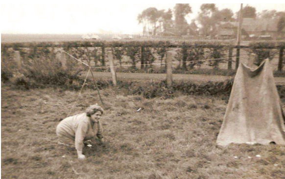
Het prille begin van wat nu Camping De Boekhorst is, rond 1965. Toen een camping voor passanten met een tent, caravan of bootje. In de verte Boerderij De Haas, nu 't Haasje.