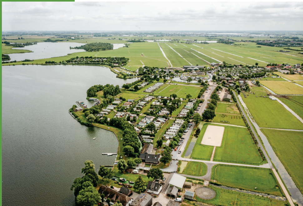
Een overzicht van de vier campings aan en bij de Kaag in 2021. Vóór camping De Horizon, links boven camping Spijkerboor en rechts campings 't Haasje en De Boekhorst.

want de verhalen zijn altijd momentopnamen. Tien jaar later kon het weer heel anders zijn. Na de oorlog was het leven anders dan ervoor. Bovendien zijn de jaartallen vaak schattingen en soms spreken ze elkaar tegen. De volgorde van de boerderijen is willekeurig maar ik begin met de boerderij / camping die de laatste tijd het meest in de belangstelling staat.