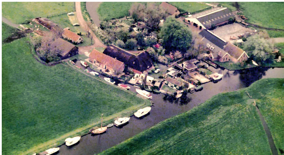
De Moppehoeve (midden) en boerderij Van Leeuwen (rechts) rond 2000, met boten en vakantiehuisjes.

Ook de eeuwenoude Moppehoeve (Roode Polder 1, Oud Ade), wat verder verwijderd van de Kaag, mocht zich verheugen in de belangstelling van waterrecreanten. Vanaf het water is de boerderij nog maar gedeeltelijk te zien vanwege de huisjes die ervoor zijn verrezen. Ik praat met twee van deze zomerhuisjesbewoners.