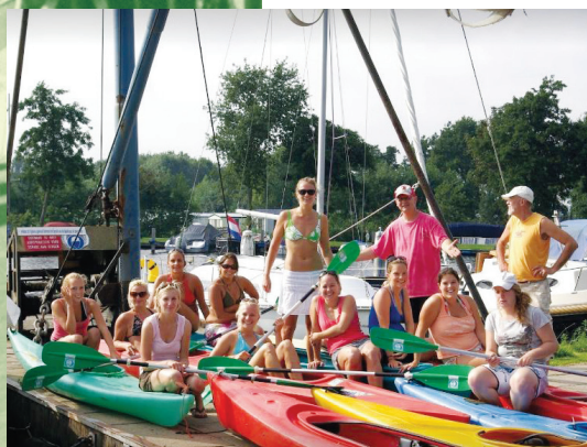
Kanovaarders bij Spijkerboor, recent.