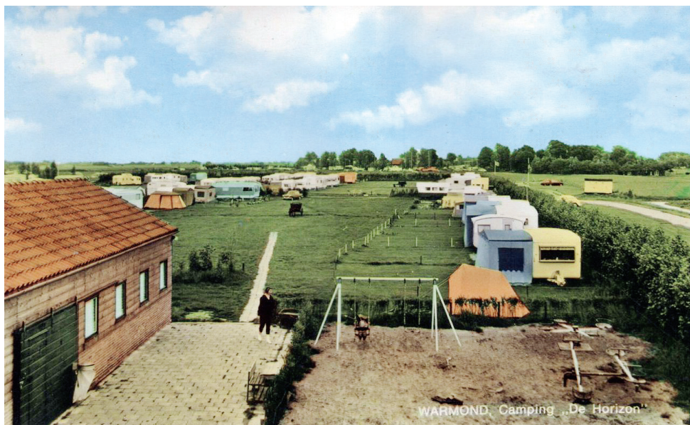
Camping De Horizon, ca 1967.

Koos de Haas had tien dochters en één zoon, Leen (1936-2013). Deze had echter geen zin in het boerenbedrijf en besloot een camping te beginnen. Het bleek een goed moment want rond die tijd werd in het gemeentehuis van Warmond juist gesproken over een uitbreiding van het campingaanbod aan de overkant van de Kaag.